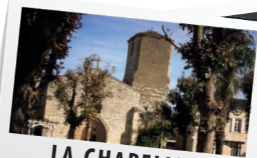
LA CHAPELLE DES CORDELIERS

Ce circuit du cœur de ville ouvre à la découverte des monuments de son lointain passé et de ses traditions : Église Saint-Pierre, la Tour du Chapitre, Chapelle des Cordeliers, sans oublier le poumon du bourg : les arènes Joseph Fourniol, mais aussi des lieux insolites. Ouvrez grand les yeux !