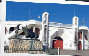
LES ARÈNES JOSEPH FOURNIOL