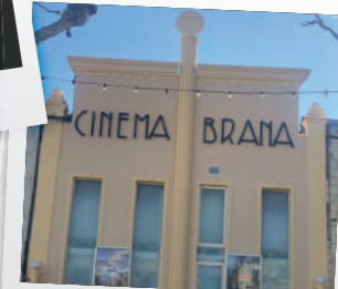
LE CINEMA BRANA