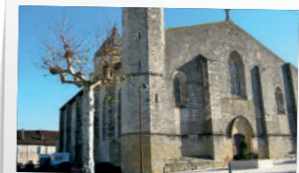
L'ÉGLISE SAINT PIERRE